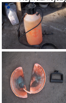
Rys. nr 2. Widok przenośnego opryskiwacza ciśnieniowego typu „ORION” V-12 P – 110/2 z oderwanym dnem.

Najważniejszym osiągniętym efektem dobrowolnej atestacji wyrobów na Znak Kasy wydaje się jednak wzbudzenie zainteresowania wielu producentów kwestią bezpieczeństwa użytkowników ich wyrobów. Bezpieczeństwo wyróżnionych Znakiem KRUS wyrobów potwierdza praktyka. Zawiodły tylko nieliczne wyroby. Do groźnego wypadku w dniu 14. stycznia br., któremu uległ rolnik z powiatu częstochowskiego podczas użytkowania opryskiwacza ciśnieniowego typu „ORION”, oznaczonego Znakiem KRUS. Poszkodowany w wypadku rolnik – po napełnieniu opryskiwacza roztworem fungicydu przystąpił do napompowania powietrza do opryskiwacza i podczas wykonywania tej czynności nastąpiło rozerwanie i oderwanie dna zbiornika (rys. nr 2) – rolnik został uderzony podczas wybuchu w twarz ręką ręką opryskiwacza. Główną przyczyną wypadku była wada materiałowa zbiornika, wykonanego z poliuretanu. W dniu 2006.02.20. pracownicy Kasy i producenta dokonali oględzin rozerwanego opryskiwacza – stwierdzili, że wada materiałowa zbiornika była wyłączną przyczyną wypadku rolnika. Przygotowywana jest procedura odebrania cofnięcia zezwolenia nr 4/99, upoważniającego producenta do oznaczania Znakiem Kasy 4. typów tych opryskiwaczy.