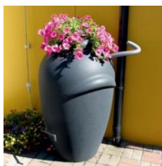
Odprowadzenie i zagospodarowanie wód opadowych