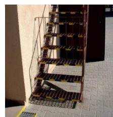
Zabezpieczenia schodów i przejść na wysokości barierkami i listwą podłogową