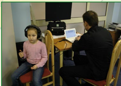
Audiometryczne badanie słuchu u dziecka

Badania audiometryczne dostarczają informacji o sprawności słuchu dziecka w zakresie niskich, średnich i wysokich tonów. Podczas badania dziecko ma założone słuchawki i sygnalizuje, czy słyszy określone dźwięki. Badania te można rozszerzyć o badania zrozumiałości mowy oraz testy, które oceniają sprawność ośrodków słuchowych położonych w mózgu. Badania audiometryczne są całkowicie nieinwazyjne, bezbolesne i nieuciążliwe dla dziecka.