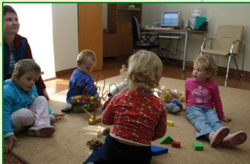
Dzieci w czasie zajęć rehabilitacyjnych

Dzieci z ubytkami słuchu, nawet najmniejszymi, nie mogą swobodnie odbierać mowy, zwłaszcza na odległość. To ograniczenie ma negatywne konsekwencje w odniesieniu do życia i funkcjonowania w grupie przedszkolnej, a następnie w klasie, ponieważ odległość od źródła dźwięku ma wpływ na możliwość biernego, przypadkowego słuchania i uczenia się. Bardzo małe dzieci w większości uczą się nie przy stoliku logopedy, lecz podczas zabawy, wtedy gdy mogą słuchać rozmów, które wysłuchują z różnych odległości. A zatem, każdy typ i poziom utraty słuchu lub jego zaburzenie jest dużą barierą dla dziecka w odbiorze informacji z otoczenia. Stąd potrzeba rehabilitacji, a w jej programach także bezpośredniego, dydaktycznego nauczania wielu umiejętności językowych, których inne dzieci uczą się w sposób naturalny, przypadkowy.