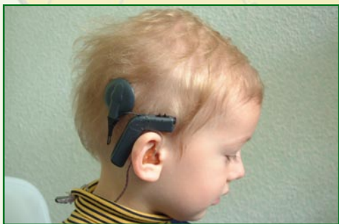
Chłopiec z implantem ślimakowym

Implant ślimakowy jest jednym z największych osiągnięć medycyny i techniki ostatnich 30 lat. Dzięki niemu można znacząco podnieść jakość życia różnych grup pacjentów. Stwarza on realną szansę na wejście w świat dźwięków dzieciom z całkowitą głuchotą, które nie słyszały od urodzenia. Dzieciom, które słyszały, ale utraciły z różnych przyczyn słuch, daje możliwość powrotu do świata dźwięków. Dzieciom niedosłyszącym, u których aparaty słuchowe nie dają zadowalających efektów, może w sposób istotny poprawić rozumienie mowy. Nowym wskazaniem do stosowania implantów ślimakowych jest tzw. częściowa głuchota, która charakteryzuje się prawidłowym słyszeniem niskich tonów oraz brakiem słyszenia tonów wysokich.